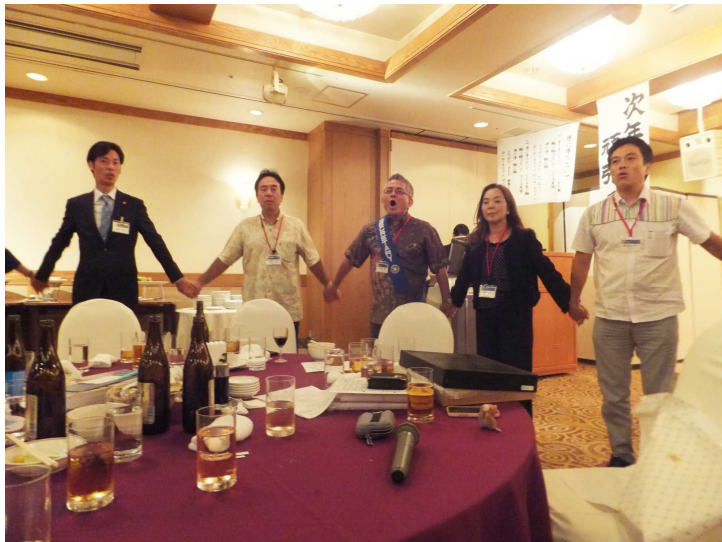
夜間例会スナップ