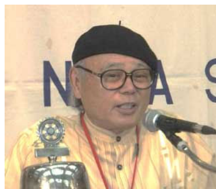
崎濱職業分類&会員選考委員長