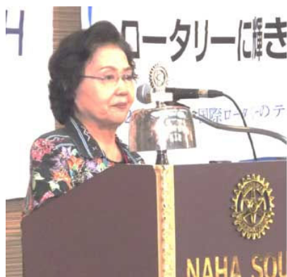
友利社会奉仕委員長