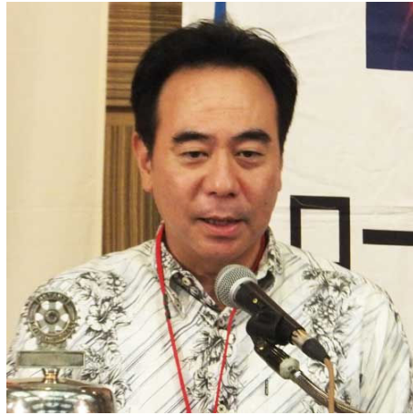
知名会員誕生日お祝い