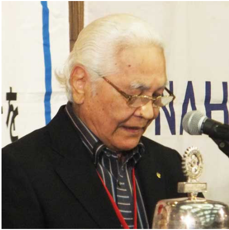
與那嶺 PP ロータリーの目的朗読