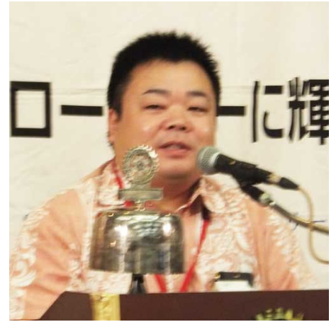
林会員誕生日お祝い