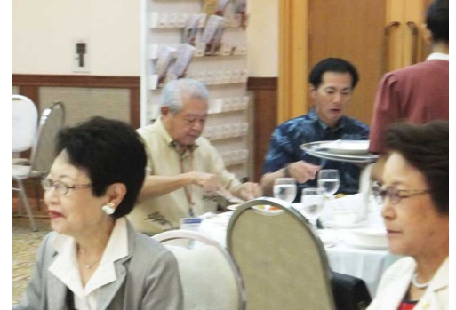
横須賀 RC のハイエージ会の皆さん