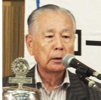
高地様より卓話を頂きました。