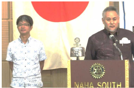
・コザ RC 島会長・田里幹事より IM の呼びかけ。