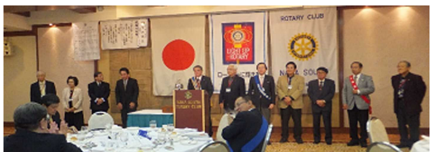
知名次々会長 當野次年度会長よりご挨拶