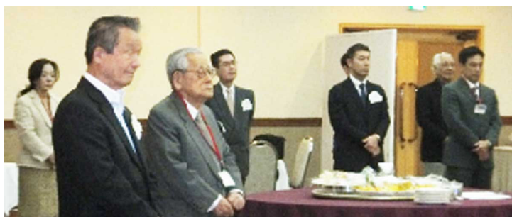
・たくさんのビジターの皆様にご出席頂きました。