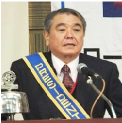
←田畑会長、ごあいさつ。