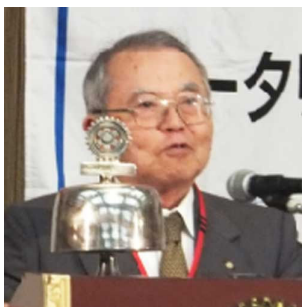
・チャーターメンバ春島美也富 P.P