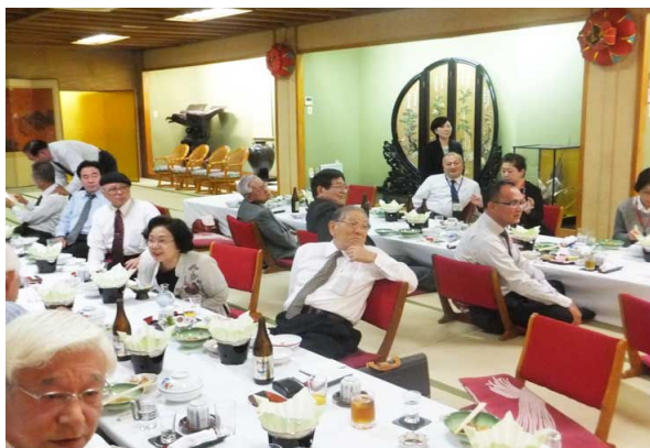
和やかな懇親会でした。