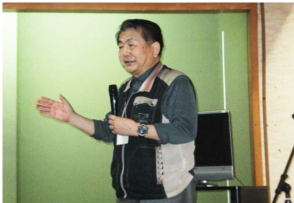
富山南RC寺林会長ごあいさつ