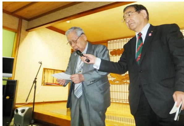
中地パスト会長 乾杯の音頭