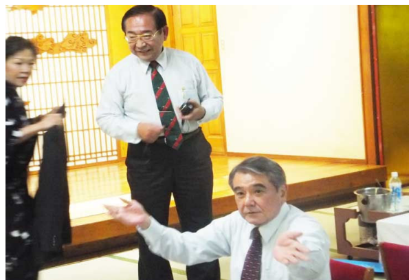
田畑会長よりカチャーシー講習。