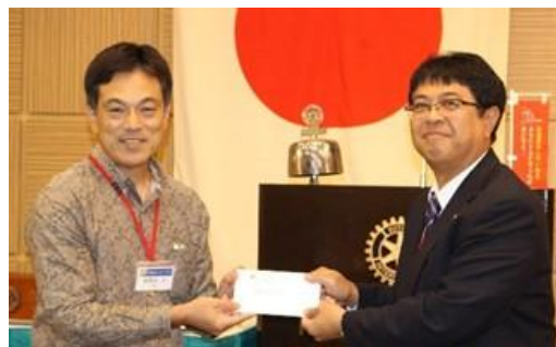
喜屋武力会員 4/7 お誕生日おめでとうございます