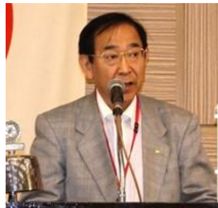
(*^_^*)2017~2018年度地区研究協議会参加者による報告会(*^_^*)