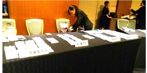
沖縄分区登録会場