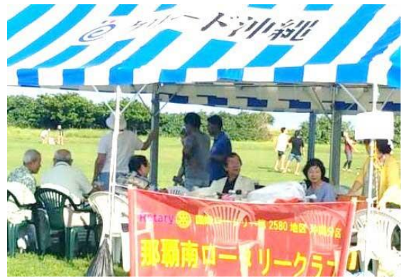
クラブ名入り横断幕が鮮やかです！