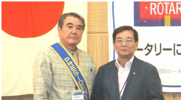
當野地区ロータリー財団委員へ委嘱状授与