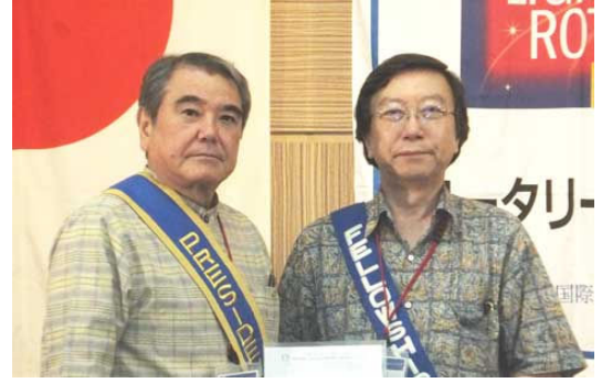
稲垣地区職業奉仕委員へ委嘱状授与