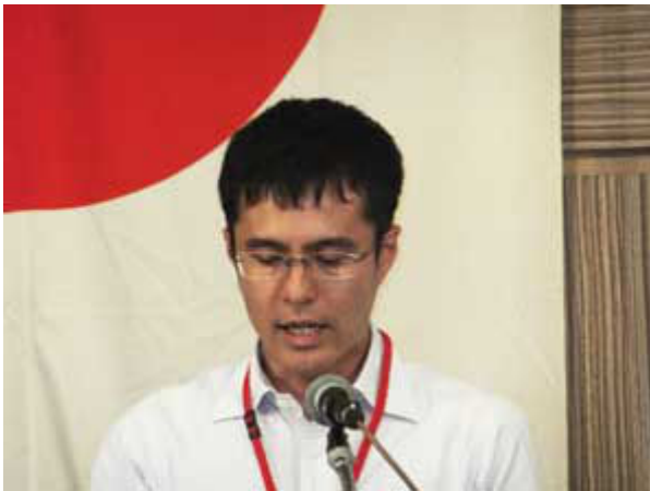
赤嶺会員『ロータリーの目的』の朗読