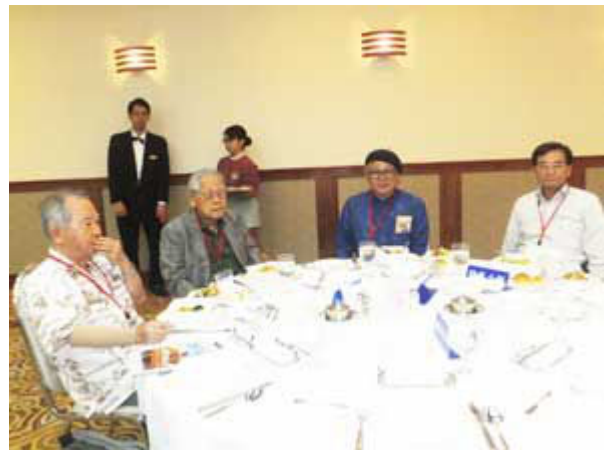
春島 PP 中地 PP 崎濱 PP 當野 PP