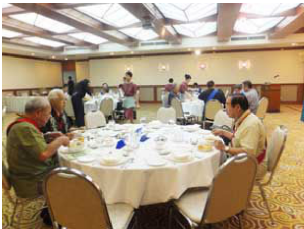
和やかな例会風景