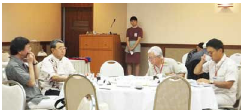
和やかな例会風景