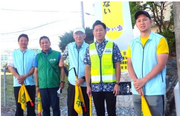
クラブ名誉会員徳元次人豊見城市長と記念撮影。