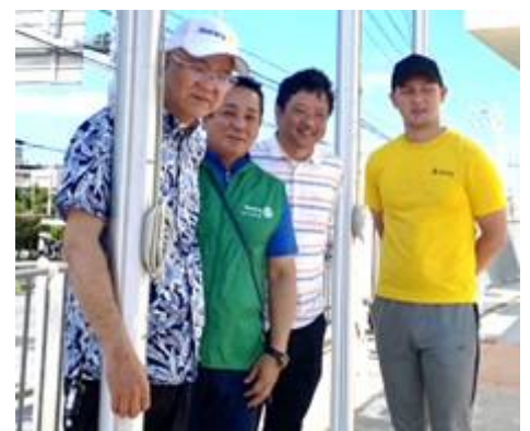
活動を終えて。お疲れ様でした。