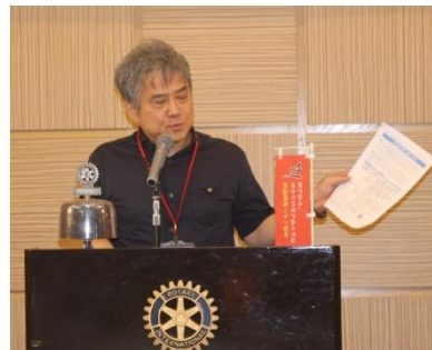
赤嶺社会奉仕委員長より社会奉仕通信 5月号紹介当クラブ活動が載っています！