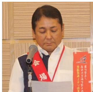
國場会員『ロータリーの目的朗読』