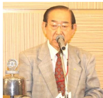
竹林R情報研修委員長