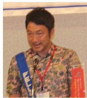
各種報告萩原会員