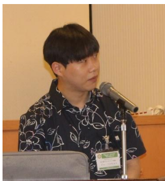
ソンヒョンさんライラ報告