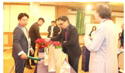
楽しいゲームタイムでした！