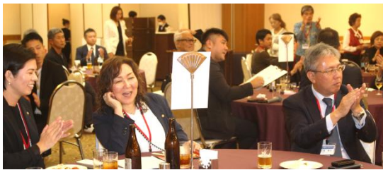
2025-26 年度 望年会懇親会風景