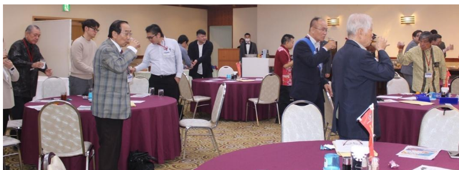
創立五十一周年・新年を 祝して乾杯