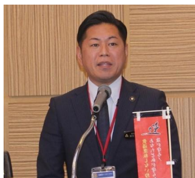
乾杯 徳元次人豊見城市長