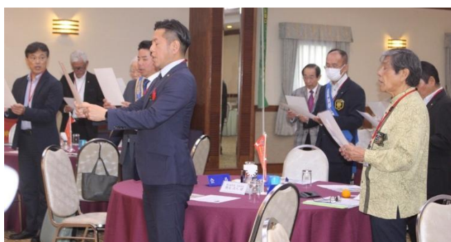
皆でロータリーの目的朗読