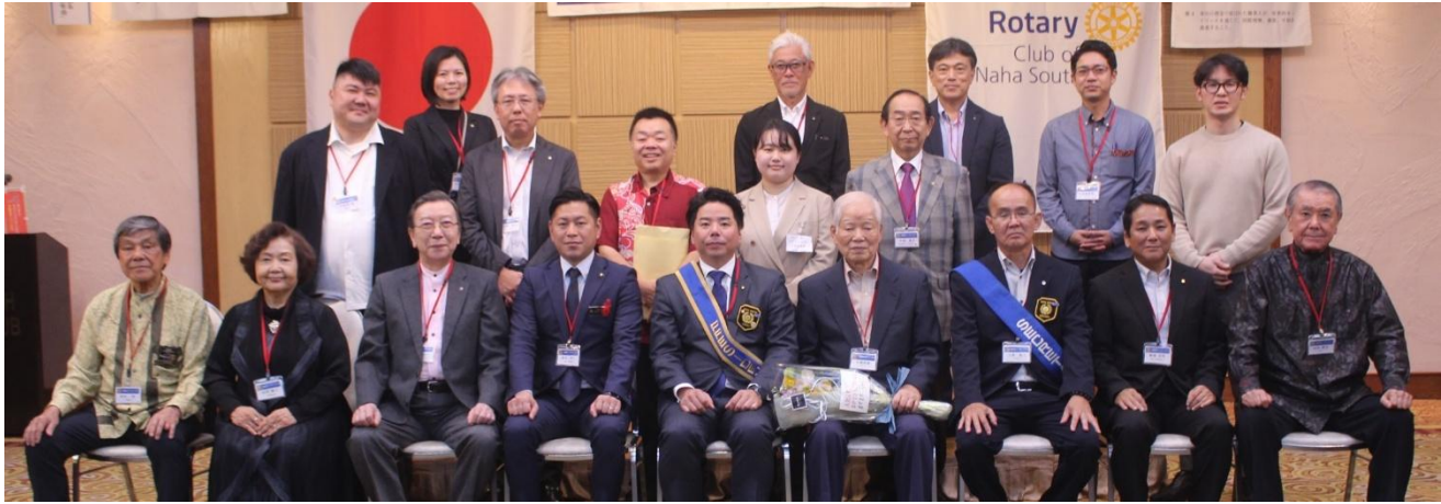
祝創立五十一周年・新年会