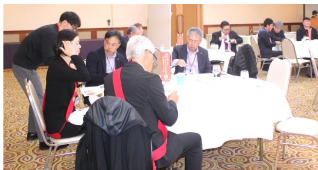
例 会 風 景