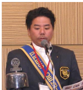
當野会長あいさつ