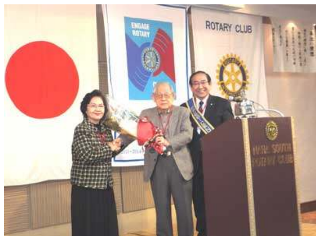
中地昌平パスト会長90歳祝